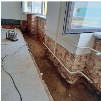
foto před realizací a v průběhu