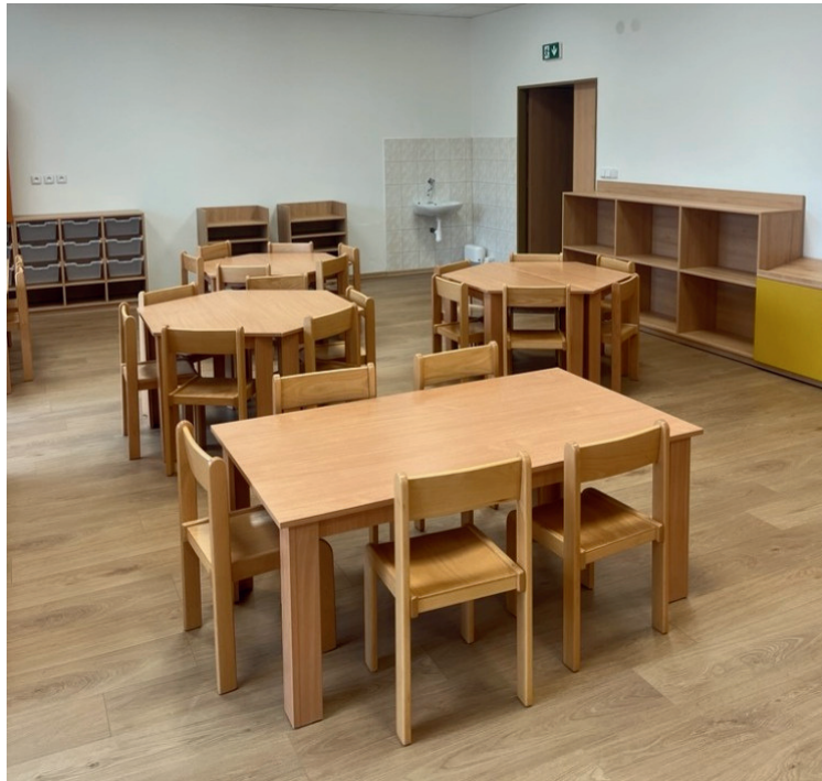
foto po realizaci